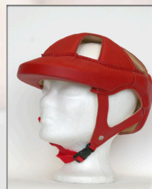
Willo Sport in Indischrot