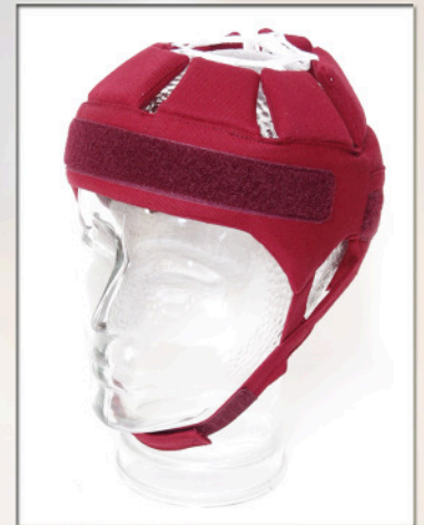
Kids High Protection in Rot