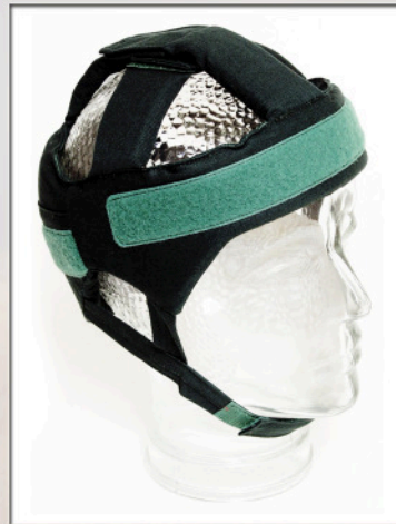
Kids Protection in Grün

Durch unser reichliches Zubehör ist eine optimale Anpassung an die unterschiedlichen Bedürfnisse der Benutzer gegeben. Zudem lösen wir im Sonderbau die außergewöhnlichsten Wünsche.