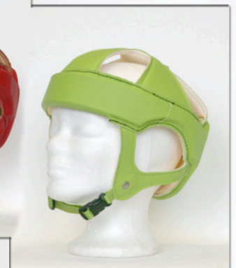
Orient Sport in Lemongrün