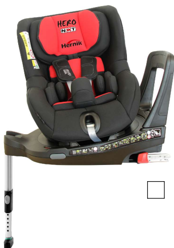
HERO-NXT rot-schwarz (470000-D1)

ACHTUNG: ISOFIX-Anschluss im Kfz. ist zwingend erforderlich!!!