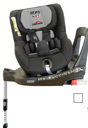
HERO-NXT grau-schwarz (470000-D2)